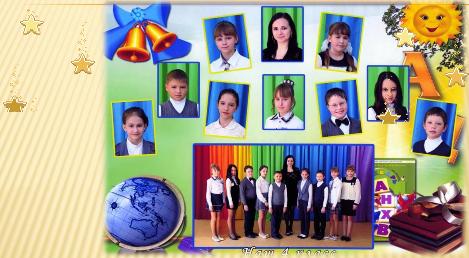
Наш 4 класс

29 мая 2017 г. состоялся окружной торжественный выпускной вечер в 4 классе на базе Семибратовского СДК. В этот день было все: и награждения отличников и активистов, и веселье, и смех, и трогательные стихи и песни, посвященные учителям и школьникам.